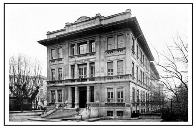
La sede storica della biblioteca negli anni '30