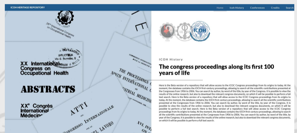
Pagina di prova dell'archivio digitale